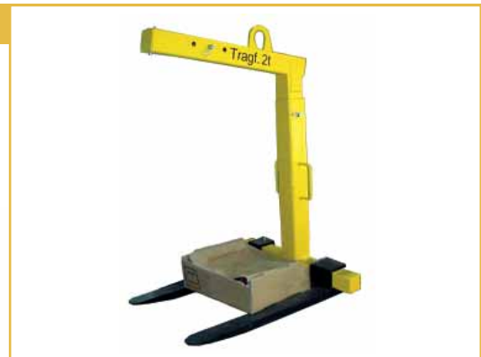
Lieferung ohne Anschlagseile, Rundschlingen, Bandschlingen oder Kettengehänge.