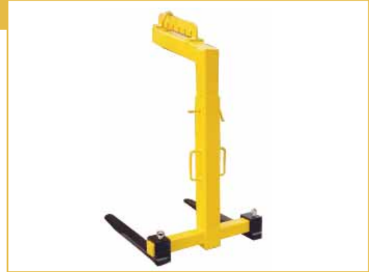
Lieferung ohne Anschlagseile, Rundschlingen, Bandschlingen oder Kettengehänge.